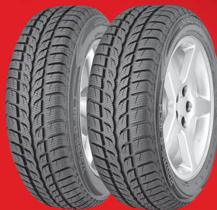
MS plus 6 MS plus 66

- ilyen körülmények között kivételesen rövid fékút érhető el használatával. Ennek oka az, hogy a mintázat gyorsabban alkalmazkodik a vizes útviszonyokhoz a kialakításának és a futófelületi keverékhez adott nedves tapadást elősegítő polimereknek köszönhetően. A középső blokkok különleges kialakítású, esőcsepp formájú elemei elősegítik a