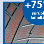
Téli kopásjelző (4 mm)